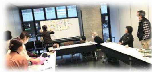
最後には描いた作品に先生からアドバイスをいただきます