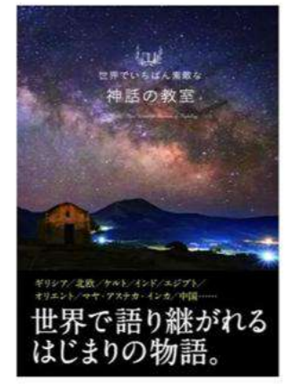
『世界でいちばん素敵な神話の教室』 蔵持不三也/監修 三才ブックス