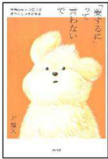
『要するに』って言わないで 尹雄大/著 垂紀書房

「ハツとして! GOODカード」とは本の中に書かれている、カッコいい、心揺さぶる、胸に響く、そんなグッとくる言葉やフレーズを紹介するPOPです。グッとくる言葉やフレーズをいくつも持っていれば、カッコいいと思いませんか? それも名刺サイズだからコレクションにもなります。館内でお配りしていますので、皆さんも集めてみませんか?