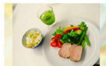
写真は過去のメニューです

7月12日・19日・26日、 8月2日(日)全4回 10:00~12:00 対象:どなたでも 定員:34人 講師:kulele(クーレレ/しま) 料金:3,200円 申込:6/5(金)~