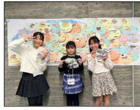
▲まりんスマイル研究部のみなさん

まりんスマイル研究部です。私たちは、小学6年生2人と小学3年生1人で活動をしています。主に海の環境問題について調べて、これからの地球を守るためにできることをYouTubeなどで発信活動しています。