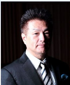
小池弘之 (ヴァイオリン)