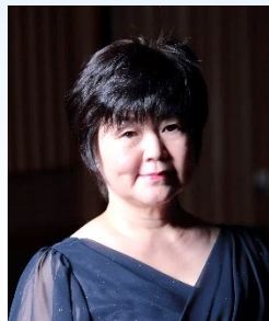
小池里枝 (ヴァイオリン)