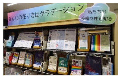
▲上戸田分館特集棚