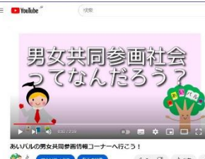
▲YouTube 配信 等