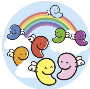
◀戸田市男女共同参画キャラクター ビリーちゃん&リブちゃん