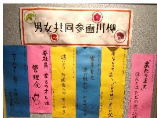
▲男女共同参画川柳