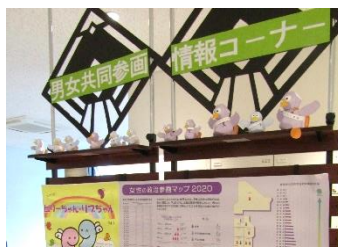
▲男女共同参画推進コーナー