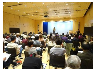
▲フォーラム・パネル展