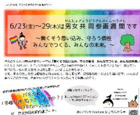
▲ミニコミ誌コラム